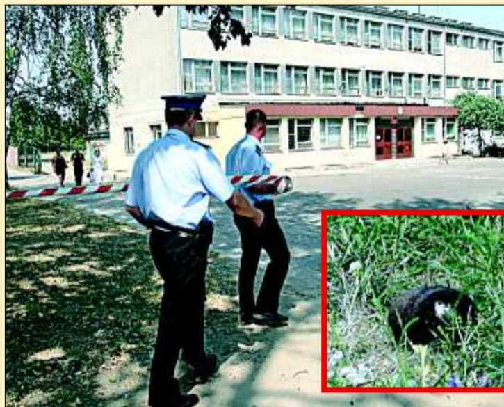
Policja zabezpieczyła zagrożony rejon. Zdaniem saperów, gdyby doszło do eksplozji pocisku (na małym zdjęciu), z sali gimnastycznej pozostałaby sterta gruzu, a w okolicznych blokach wypadłyby szyby.

Strach pomyśleć, co by się stało, gdyby doszło do eksplozji głowicy bojowej panzerfausta, którą ktoś podrzucił na boisko Szkoły Podstawowej nr 187 przy ul. Tatrzańskiej. Na szczęście pocisk zauważył pracownik szkoły i zawiadomił policję. Niewybuch wywieźli i zdetonowali saperzy z Tomaszowa.